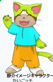
静介イメージキャラクター かいごっちゃん