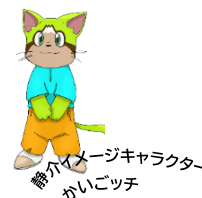
介護イメージキャラクター かいごツチ

一般社団法人静岡県介護福祉士会 事務局担当:平野／藤浪 〒420-0856 静岡市葵区駿府町1-70 静岡県総合社会福祉会館4階 TEL 054-253-0818 FAX 054-253-0829 http://shizukai.jp e-mail:shizukai@cy.tnc.ne.jp